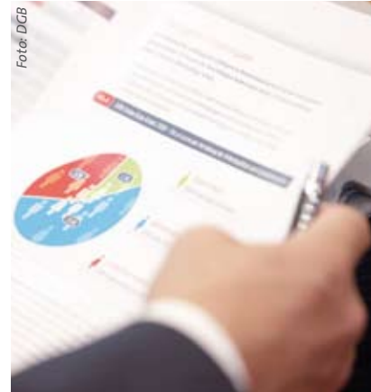
Der aktuelle DGB-Index Gute Arbeit

Grundversorgung für die Bevölkerung kaum noch gegeben. Globalisierung darf nicht zum Abbau des Sozialstaates führen. Vielmehr sind sozialstaatliche Elemente die Voraussetzung für eine gleichgewichtige und faire Globalisierung. Die deutschen Gewerkschaften unterstützen dabei auch freiwillige Initiativen.