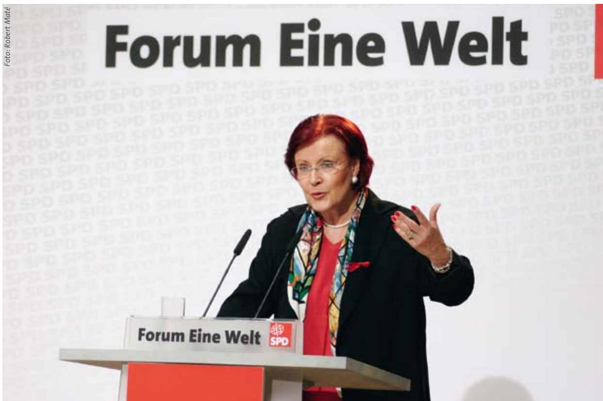
Heidemarie Wieczorek-Zeul auf der Klimakonferenz im Willy-Brandt-Haus in Berlin am 29. November 2007

Zudem brauchen wir einen UN-Weltwirtschaftsrat, der wirtschaftliche und soziale Fragen auf höchster Ebene durch die Vertretung aller Regionen der Welt nachvollziehbar diskutiert. Denn wir brauchen mehr Kohärenz in der Wirtschaftspolitik.