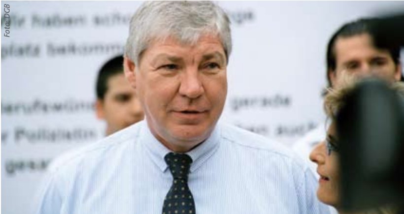
Ausbildungsaktion vor dem Bundesrat