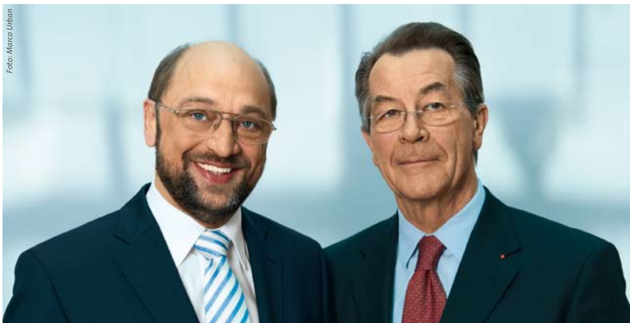
Martin Schulz, Spitzenkandidat der SPD für die Europawahl, und SPD-Parteivorsitzender Franz Müntefering

bessere Regelungen für die internationalen Finanzmärkte. An diesen Forderungen halten wir fest: wir wollen eine neue Finanzmarktarchitektur mit klaren politischen Verkehrsregeln auf nationaler, europäischer und globaler Ebene durchsetzen, die alle Finanzakteure umfassen.